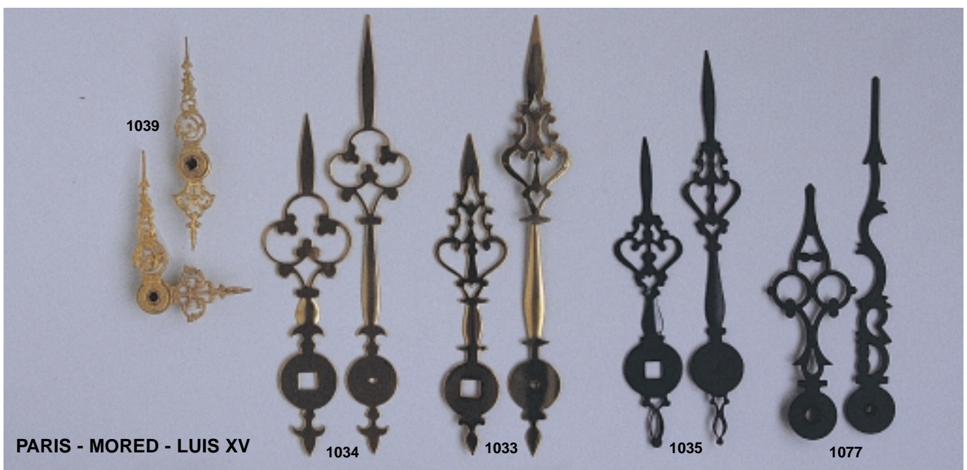
PARIS - MORED - LUIS XV